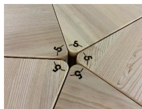
Table 100% Bois Massif 3.4.5